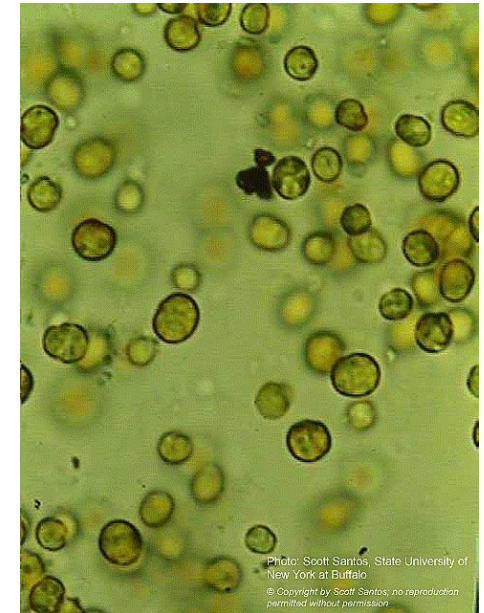
Pequeñas células vegetales llamadas zooxantelas que viven dentro de la mayoría de los tipos de pólipos de coral (NOAA, 2017)

https://oceanservice.noaa.gov/education/tutorial_coral/coral02_zooxanthellae.html