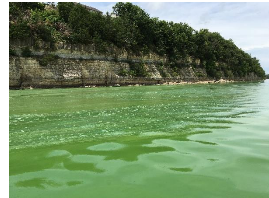
La floración de algas nocivas tiñe de verde esmeralda el agua del Lago Milford (Graham, 2016)

National Ocean Service (2021). What is eutrophication?. National Oceanic and Atmospheric Administration . https://oceanservice.noaa.gov/facts/eutrophication.html