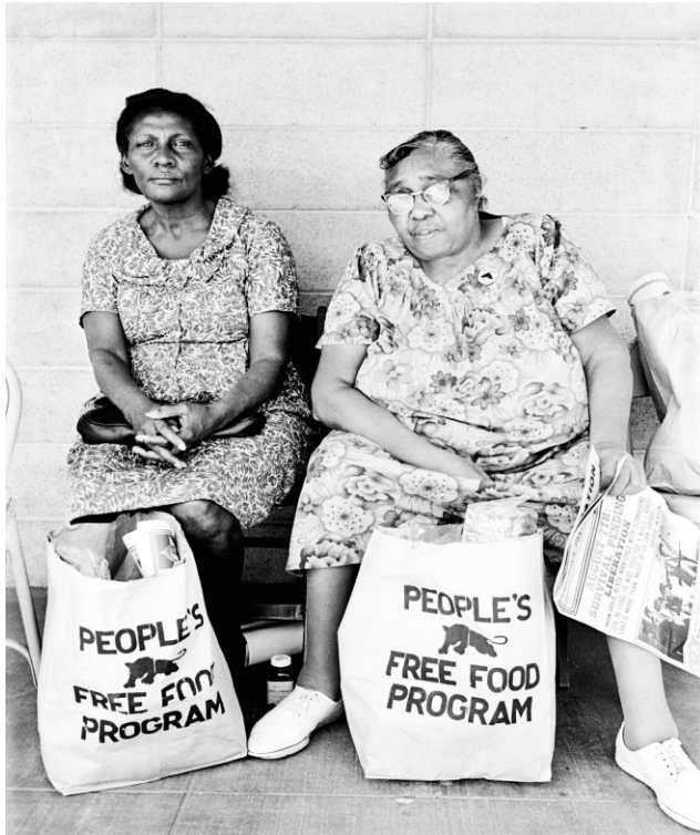
James, S. (2016, 19 de octubre). El programa de comida gratuita del pueblo [Fotografía encontrada en la Galería Steven Kasher, Palo Alto]. Extraído el 26 de febrero de 2021, https://www.anothermag.com/fashion-beauty/9194/retracing-the-creative-legacy-of-the-black-panthers