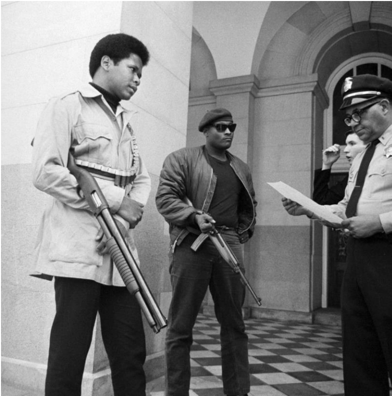
Morgan, T. (2018, 30 de agosto). La NRA apoyó el control de armas cuando las Panteras Negras tenían las armas. History.com . https://www.history.com/news/black-panthers-gun-control-nra-support-mulford-act