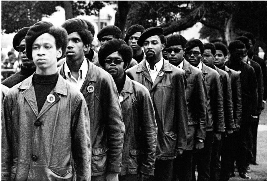
James, S. (2016, 19 de octubre). Panteras en fila en una manifestación de Free Huey [Fotografía encontrada en la Galería Steven Kasher, Oakland]. https://www.anothermag.com/fashion-beauty/9194/retracing-the-creative-legacy-of-the-black-panthers