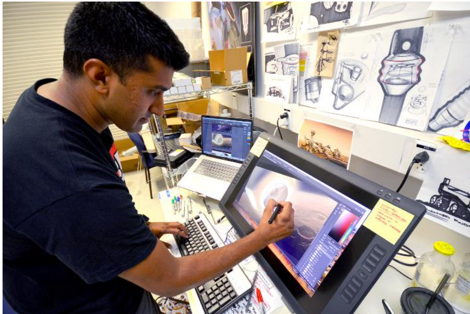
Tavernier, L., NASA, y JPL-Caltech. (2018). NASA. Extraído de https://www.jpl.nasa.gov/edu/news/tag/Career+Guidance