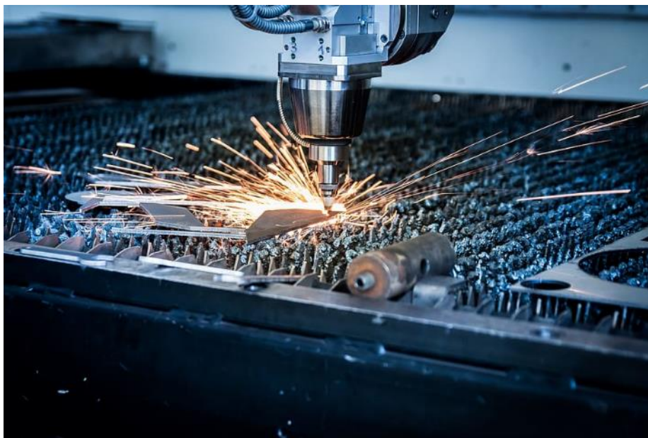
Pxfuel (sin fecha). Robótica. Pxfuel. Extraído de https://www.pxfuel.com/en/free-photo-oibxx