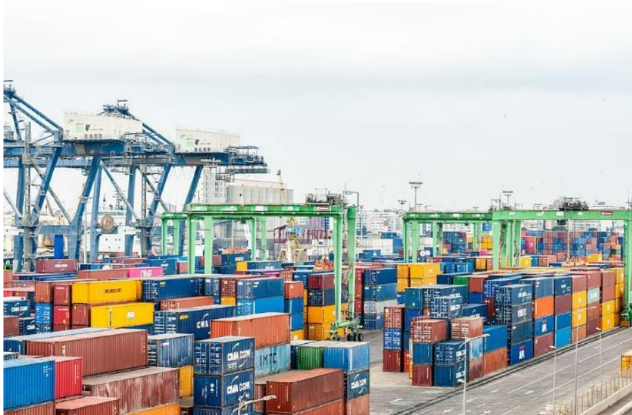
Pxfuel (sin fecha). Puerto. Pxfuel. Extraído de https://www.pxfuel.com/en/free-photo-xdoob